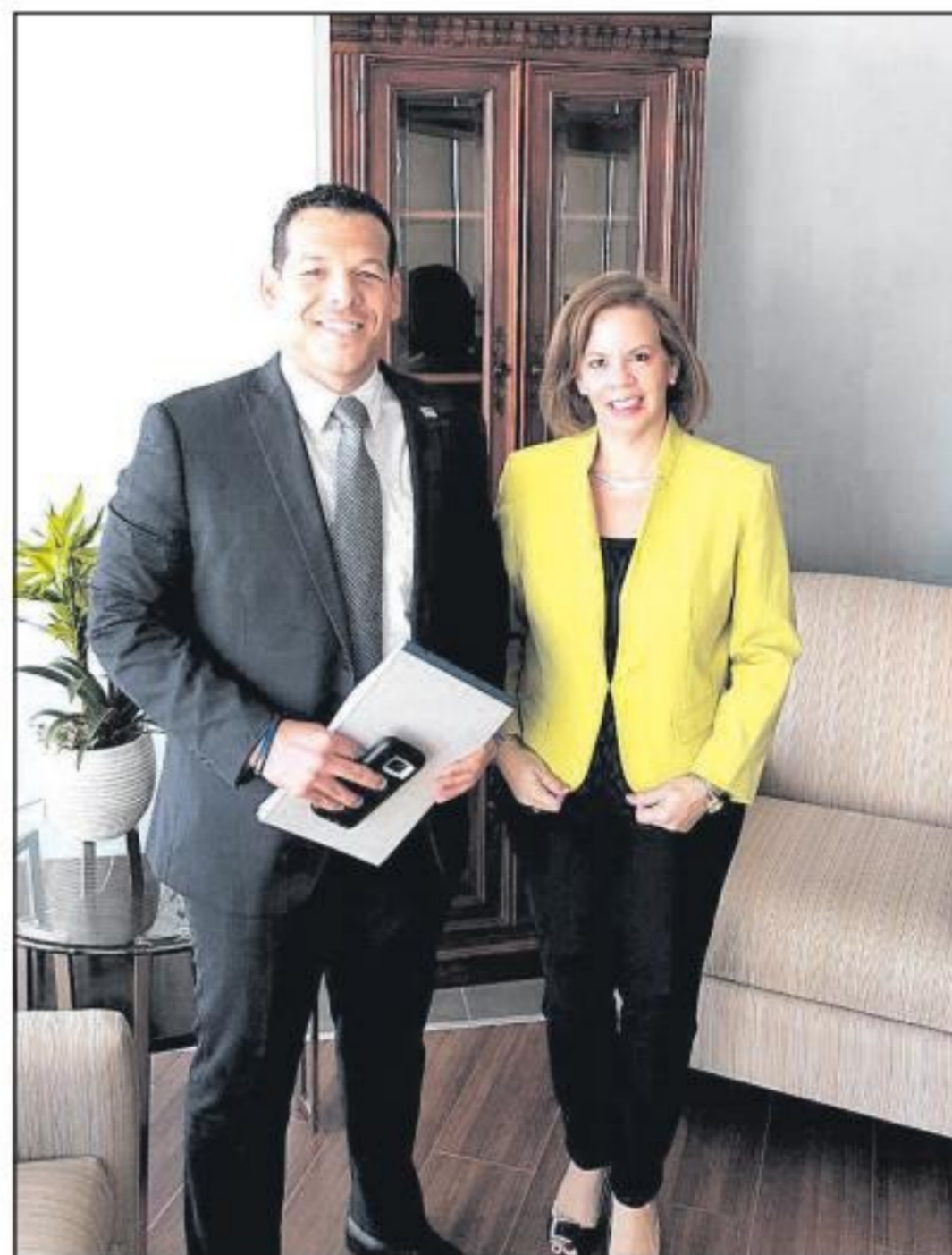
Prome Minister sra. Evelyn Wever-Croes den tur su esfuersonan pa logra

Nos kier reitera cu, Fraccion di MEP, ta sostene